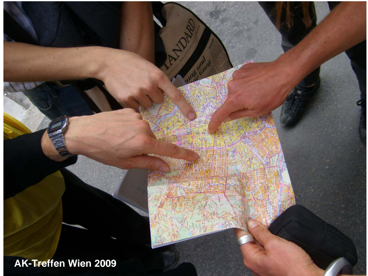
AK-Treffen Wien 2009

Mehr Infos? Hier kostenlos und unverbindlich registrieren: www.quartiersforschung.de